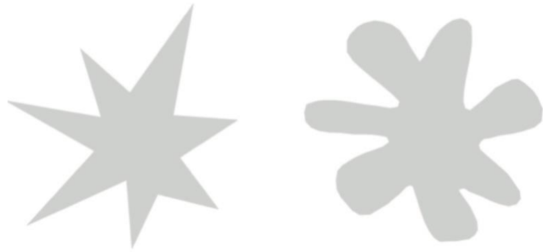
Image n° 2